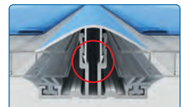
Abb. 10 mm Platten